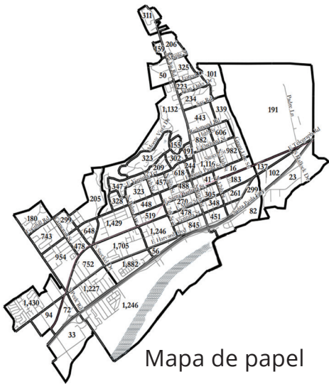
Mapa de papel

PRIMERA FECHA LÍMITE PARA ENVIAR MAPAS: VIERNES 6 DE ENERO DE 2023 A LAS 11:59 P.M.